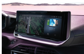
Màn hình trung tâm 10"