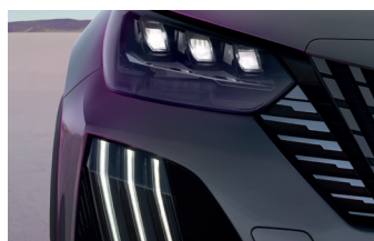
Cụm đèn LED Projector