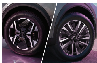
2 tùy chọn mâm 17-inch Karakoy & 18-inch Evisia